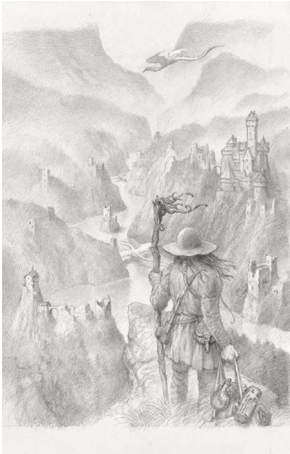
The Alchemist - Affiche des Portes du Temps Crédit : John Howe

Cette exposition mêlant architecture et fantastique compte parmi les événements mis en place pour les Portes du Temps . Ce dernier est un projet culturel créé par John Howe dans le cadre d'un partenariat avec la Collectivité Européenne d'Alsace (CEA) visant à réenchanter le patrimoine castral de la vallée rhénane.