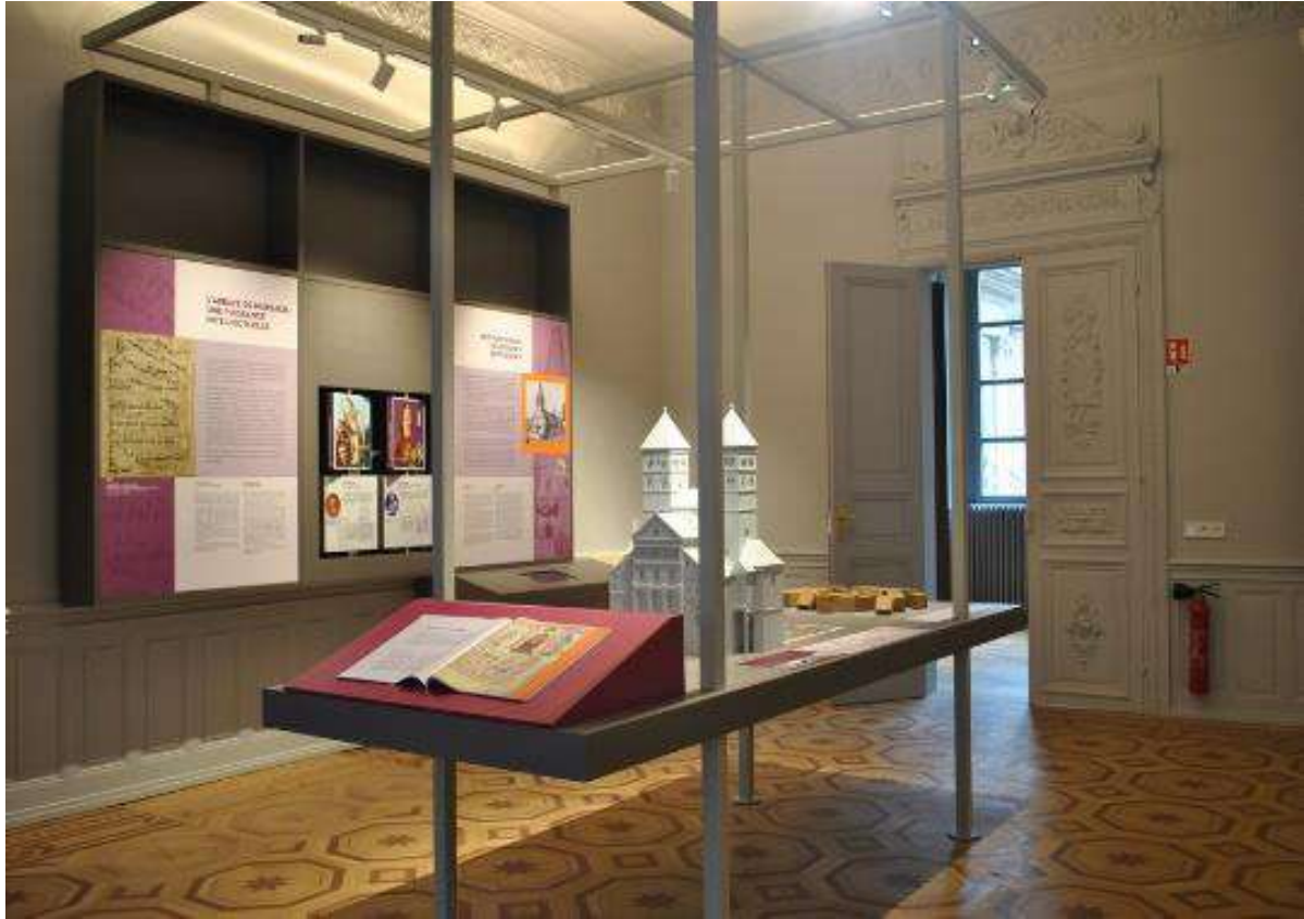
La salle du CIAP dédiée au Moyen Âge sur le territoire

La Communauté de Communes de la Région de Guebwiller, labellisée Pays d'art et d'histoire en 2004, accueille au sein du Pôle culturel et touristique de la Neuenbourg le Centre d'Interprétation de l'Architecture et du Patrimoine (CIAP).