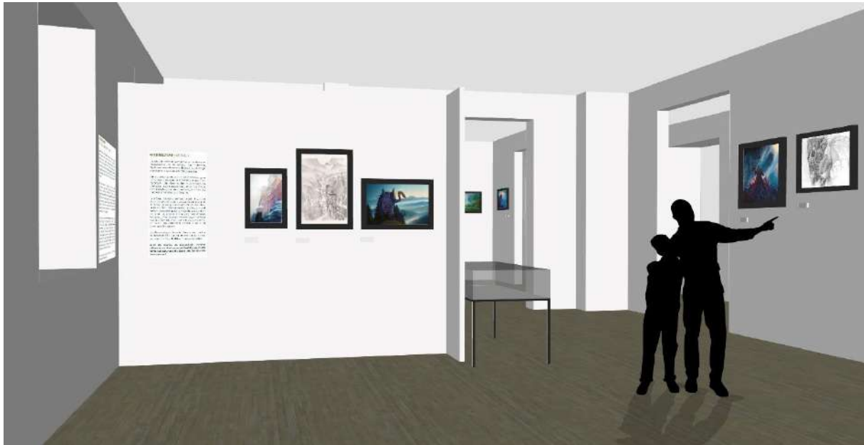
Vue projetée de l'exposition Archi-fantastic dans les salles d'expositions temporaires du château de la Neuenbourg